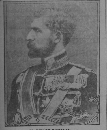
EL REY DE RUMANIA